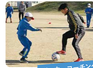
サッカーコーチング