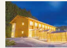
南三陸まなびの里いりやど