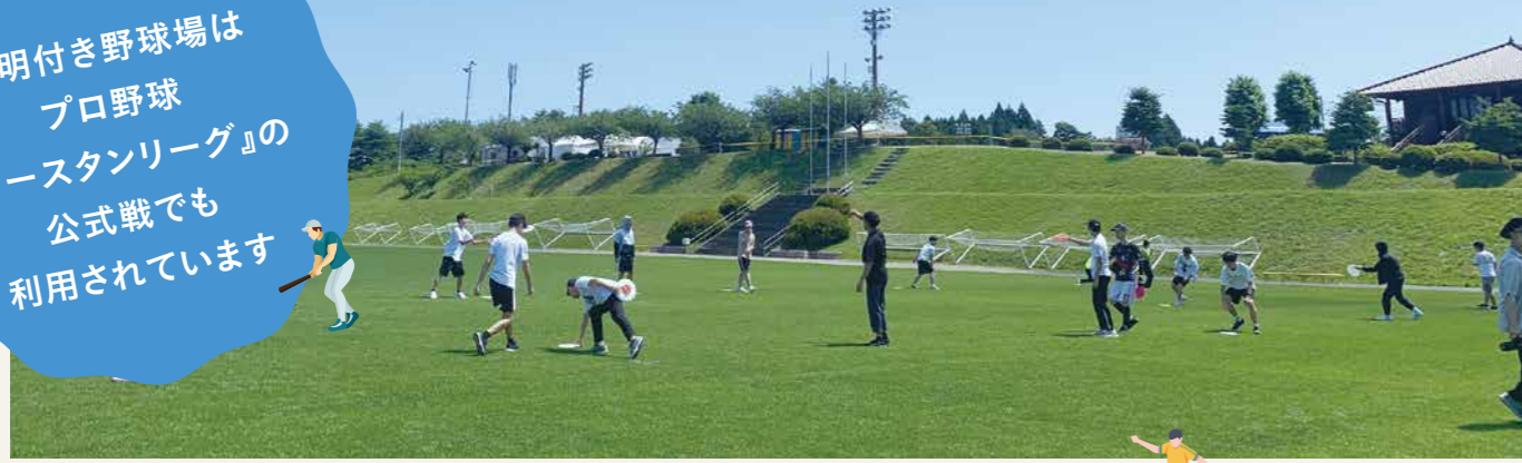
全面芝の多目的運動場

照明付き野球場は プロ野球 『イースタンリーグ』の 公式戦でも 利用されています