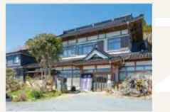
漁家民宿やすらぎ