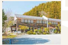
校舎の宿さんさん館