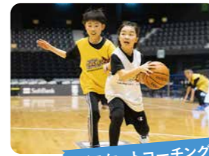
バスケットコーチング