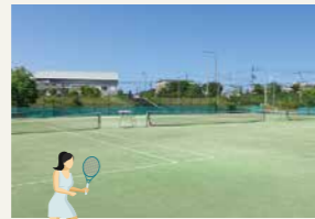
屋外テニスコート